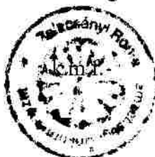
Bogdán Márk jegyzőkönyvhitelesítő